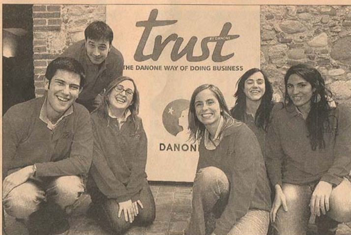
El equipo de la Universidad de Deusto, ganador de la última edición del juego de negocios online 'Trust by Danone'.

El gigante de Redmond organiza anualmente Imagine Cup , una